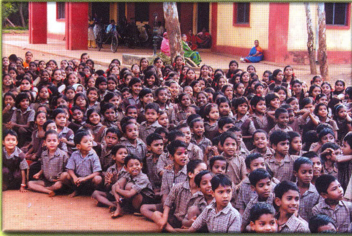
Ośrodek Jeevodaya to prawie 500 dzieci z rodzin osób dotkniętych trędem