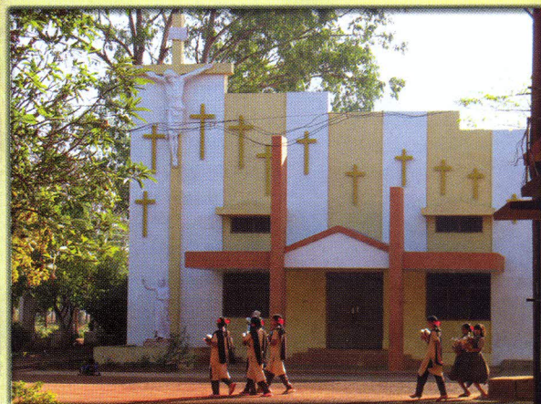
Kościół w Jeevodaya