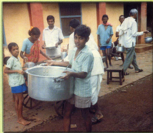
Rehabilitacja przez pracę i bycie potrzebnym trędowatych